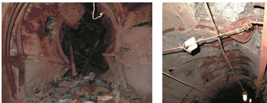
Рисунок 1. Деформации крепи горной выработки Figure 1. Mine support deformation

Применение пассивной двухслойной арочной податливой крепи с забутовкой межрамного пространства лесом – еще один негативный фактор. Такая крепь, обладая повышенными амортизационными характеристиками, способна на некоторый период времени (в практике – от 4 до 7 мес) противостоять постоянно усиливающимся смещениям в приконтурном массиве. Проблема устойчивости откаточных выработок, расположенных в зоне проявления опорного давления, является в настоящее время на подземных рудниках самой актуальной. В связи с преждевременной деформацией крепи и следующими за этим неоднократными перекреплениями откаточных выработок снижается производительность выемочной единицы, и для поддержания ее на плановом уровне необходимо увеличение площади выпуска, что усложняет своевременное поддержание горных выработок. В настоящее время откаточные выработки, уже попавшие в зону влияния опорного давления, по истечении указанного срока деформируются, и выработка подлежит перекреплению. На рис. 1 показаны деформации, изгиб и излом стоек крепи, образовавшихся в течении 2–3 мес. При этом наблюдается потеря сечения выработки на 60 %, крепь фактически неработоспособна.